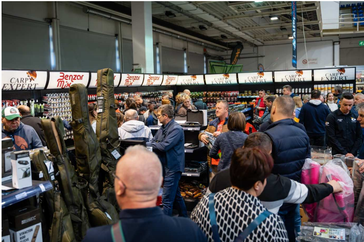
Hatalmas érdeklődés az Energofish standján

vállalat úgy volt szükség különböző tanácsadók bevonására, mert láttuk, hogy ezen tudás hiányában szinte lehetetlen a kitörés a kisvállalkozások közül. Nagy hangsúlyt fektetünk oszlopos kollégáink képzésére, hogy mindig a lehető legfrissebb tudás birtokában legyenek, ismerjék a legaktuálisabb trendeket, gyártási technológiákat, mert a folyamatos képzés is javítja a minőséget. Jelen esetben magára a munka minőségére gondolok, nem feltétlenül a termékére. A minőségi munkakörnyezet, a szakértelemmel rendelkező munkaerő, a fejlesztések mind-mind ráhatással vannak arra, hogy a polcra kerülő termék szerethető és használható legyen.